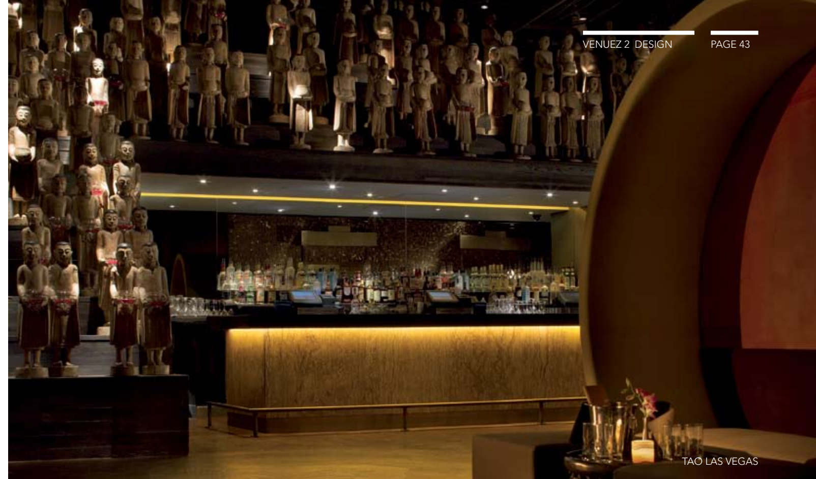
TAO LAS VEGAS

The Palms Casino Resort en de N9NE Group werd door Hugh Hefner benaderd voor de revival van de Playboy Club. Het Playboythema werd op een elegante, sensuele wijze gepresenteerd zonder ordinaar te worden. De Playboy Bunnies zijn uitgedost in Roberto Cavalli-kostuums, een redesign van de originele outfits uit de jaren vijftig. In het interieur van de venue zijn kosten noch moeite bespaard. Rijke materialen en een verleidelijke mix van rood, zwart, bruin, goud en chroom zorgen voor een warm, intiem gevoel. Elk designelement is tailor-made gemaakt, van de bunnyknopen op de banken, het behang met centerfolds in de toiletten tot aan de Diamond Bar met tienduizend diamantgeslepen kristallen. Een wand is volledig bedekt met zestig plasmaschermen waarop afbeeldingen prijken uit het archief van Playboy Enterprises. De