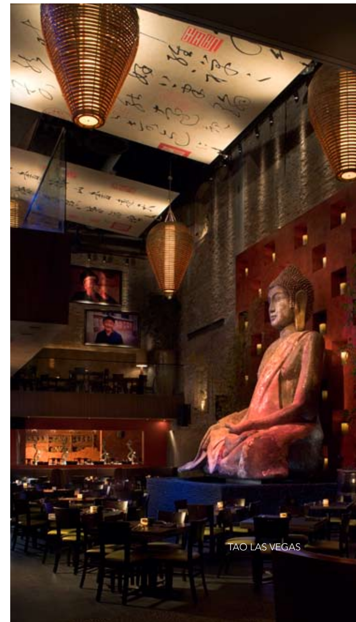
TAO LAS VEGAS

Deelnemen aan de volgende Las Vegas inspiratietour? Ketel One Vodka en Steelstuff maken het mogelijk! Stuur voor meer informatie over data, prijs en programma een e-mail met NAW-gegevens naar: paula@mondiale-nederland.nl